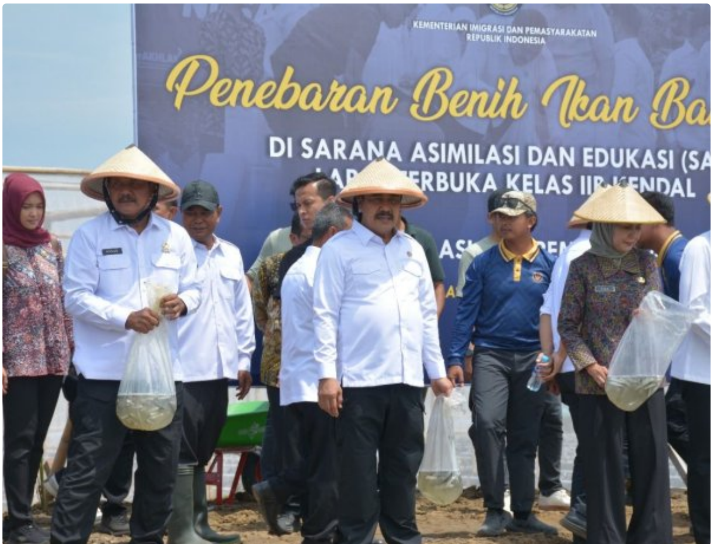
Budidaya Ikan Bandeng Lapas Terbuka Kendal, ubah Lahan Idle jadi Produktif

Kendal – Lapas Terbuka Kendal berkomitmen untuk melaksanakan program ketahanan pangan secara serius. Tidak hanya dalam bidang pertanian, Lapas yang terletak di Kecamatan Patebon Kendal ini berinovasi di bidang perikanan dengan membudidayakan ikan bandeng.