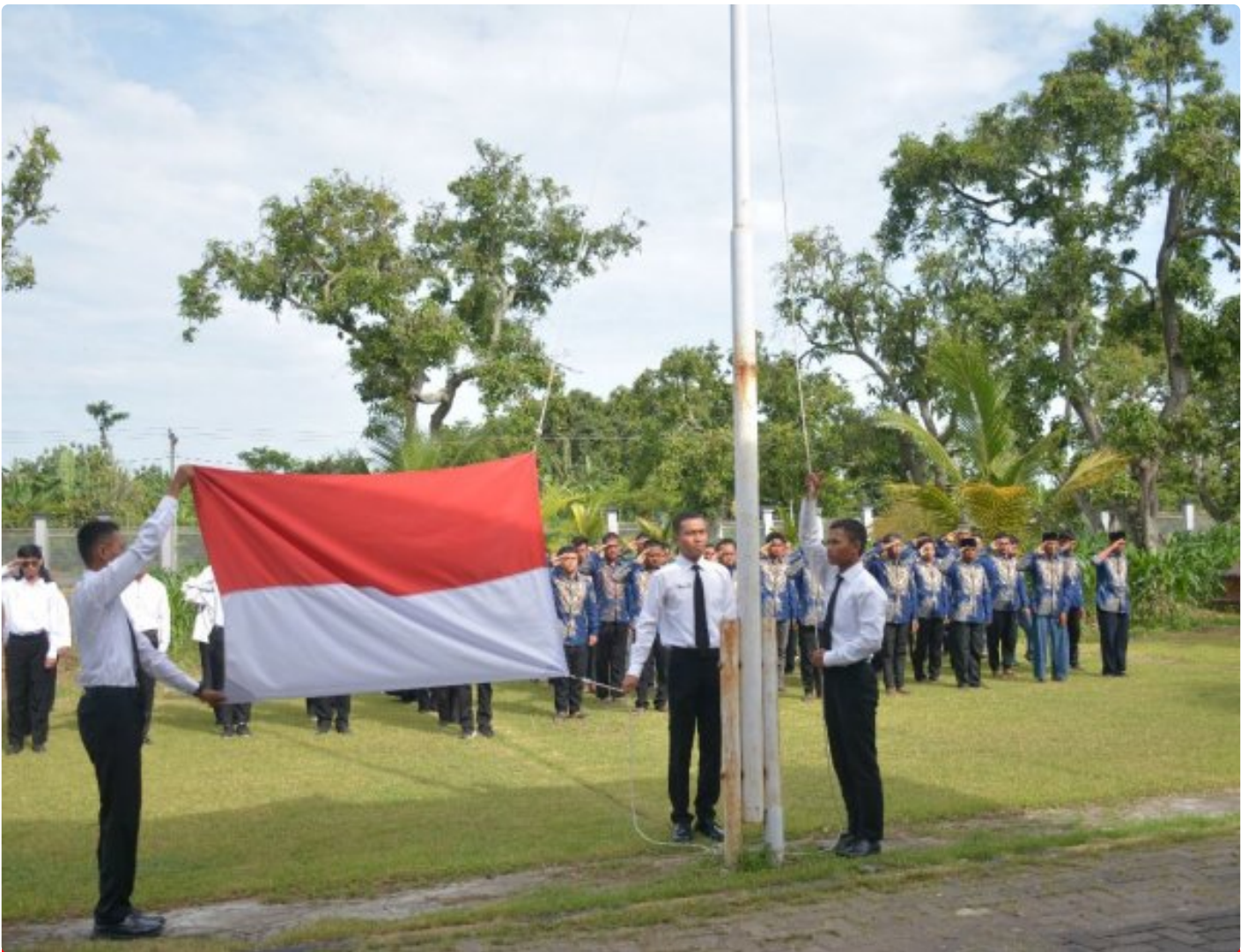
Lapas Terbuka Kendal Gelar Upacara Peringatan HUT KORPRI Ke-54

Kendal– Lapas Terbuka Kendal hari ini menyelenggarakan Upacara Peringatan Hari Ulang Tahun (HUT) Korps Pegawai Republik Indonesia (KORPRI) ke-54 Tahun 2025 di lingkungan Lapas, Senin (01/12/2025).