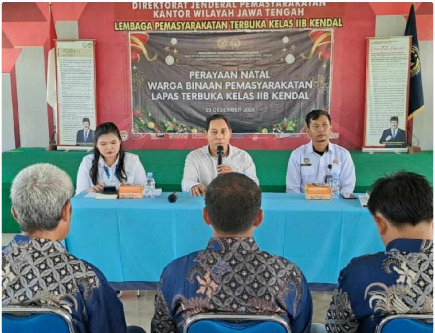
Natal Penuh Makna di Lapas Terbuka Kendal

Kendal - Bertempat di Gedung Serba Guna Lapas Terbuka Kendal telah diadakan perayaan ibadah menyambut hari Natal tahun 2025, Selasa (23/12/2025). Sukacita Natal menyelimuti Lapas Terbuka Kendal dalam perayaan yang penuh kehangatan dan harapan. Warga binaan berkumpul merayakan kelahiran Yesus Kristus dengan penuh syukur dan kebersamaan.