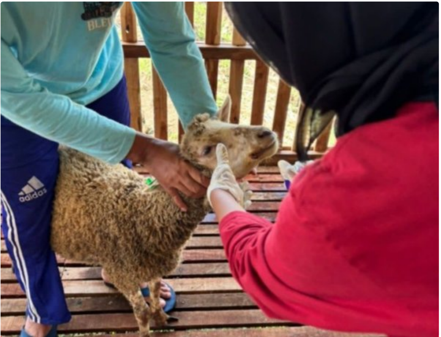
Perawatan Domba Lembaga Pemasyarakatan Terbuka kelas IIB Kendal.

Kendal - Lapas Terbuka Kendal berkomitmen untuk melaksanakan program ketahanan pangan. Bukan hanya di bidang pertanian dan perikanan, Lapas yang terletak di Kecamatan Patebon ini juga berinovasi di bidang peternakan yaitu bertenak Domba.